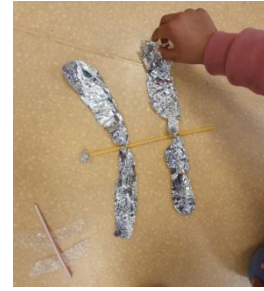
La libellule a 4 ailes transparentes, 2 gros yeux et elle est légère.

Vous trouverez sur ce site des histoires à faire écouter en podcast :